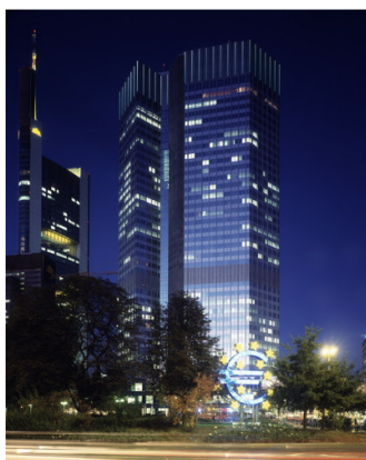
Eurotower, sediul BCE din Frankfurt, Germania, noaptea