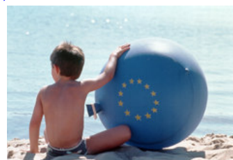
Cipru, Grecia, Franța și Malta au cele mai curate plaje din Europa

Potrivit raportului anual al Comisiei Europene privind calitatea apei de înbăiere, 96% din plaje și 92% din lacuri și râuri au întrunit standardele europene minime în materie de curățenie, în anul 2008. Se observă o ușoară îmbunătățire a situației, în raport cu anul 2007. Peste 21 400 de zone au fost verificate în anul 2008, cu 75 mai multe decât în anul precedent. Două treimi se situează pe coastă, iar restul de-a lungul râurilor și lacurilor. Italia deține cele mai multe zone costiere propice înotului, urmată de Grecia, Franța, Spania și Danemarca. Germania și Franța sunt țările cu cele mai multe ape interioare.